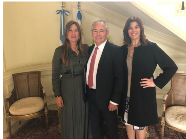
Embajador de Argentina y señora