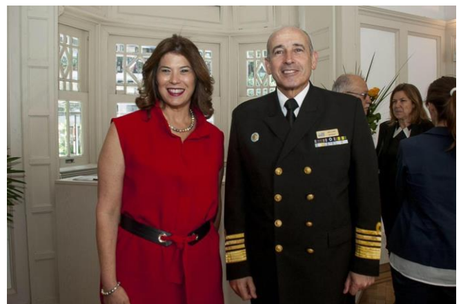
La Embajadora acompañada del Comandante en Jefe de la Armada