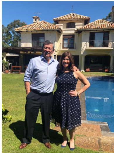
La Embajadora Abello junto al Ministro y Viceministro de Relaciones Exteriores del Uruguay