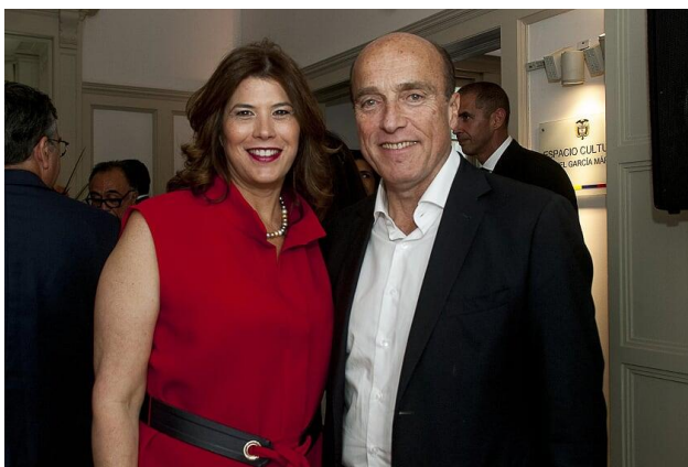
La Embajadora acompañada del Intendente de Montevideo, Daniel Martínez