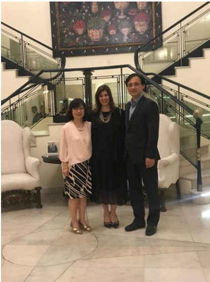
Embajador de Corea y señora