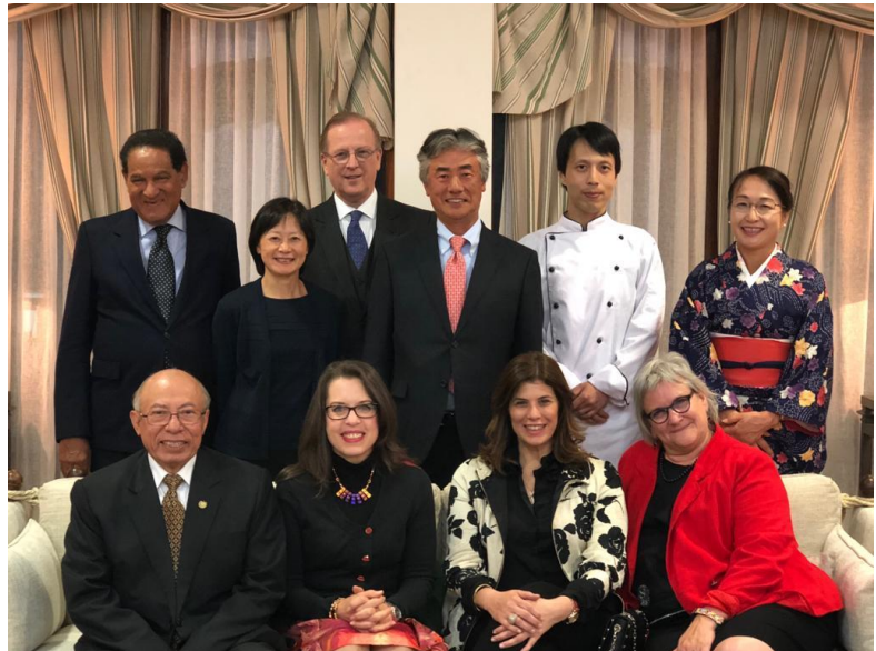
Embajadores de Japón, Canadá, USA, República Dominicana y Perú