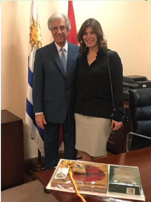
Junto al Presidente de la República Oriental del Uruguay, Dr. Tabaré Vázquez