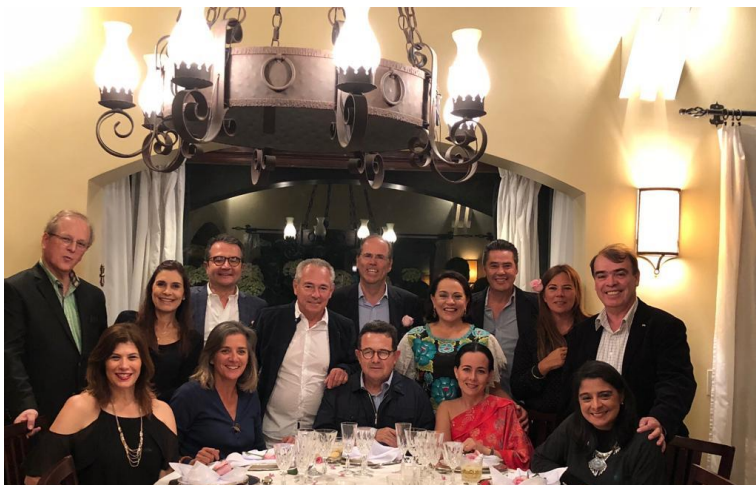
Embajadores de Perú, Costa Rica, Argentina, Portugal y México